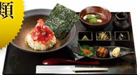
ぜいたく海鮮丼(上)